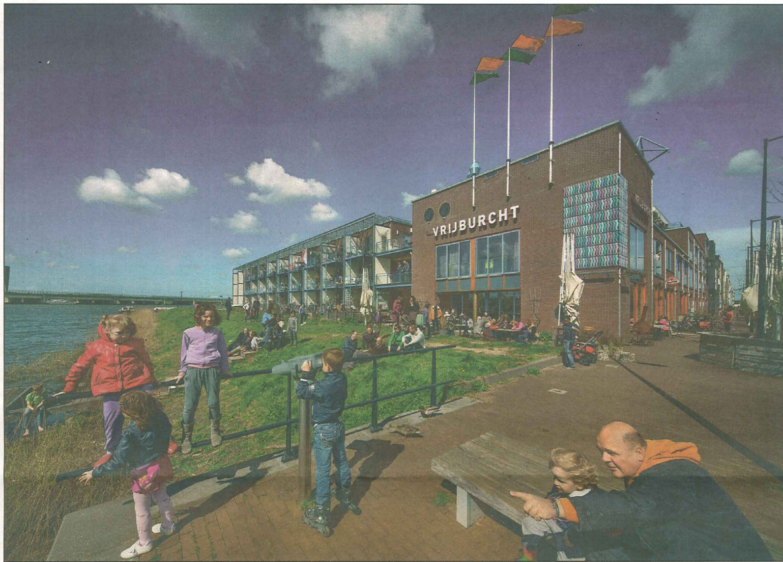
Vrijburcht is niet te missen wanneer je vanuit Oost over de fietsbrug rijdt.

Naast de 52 woningen maken een aantal bedrijfsruimtes van bewoners, een locatie van een woonzorggroep voor jongeren met een lichtverstandelijke beperking (de Roef), een ruimte voor kinderopvang (Kids Planet), café-restaurant Vrijburcht en een gemeenschappelijke ruimte die Theater Vrijburcht is geworden deel uit van het complex. Het theater wordt als enige door de bewoners geëxploiteerd. Menno legt uit hoe dit ontstaan is: "Vanaf het begin zitten een acteur en actrice binnen de groep en die wilden heel graag een oefenruimte. Dat werd een gemeenschappelijke ruimte die vervolgens organisch is gegroeid. We hingen bijvoorbeeld een beamer op om films te draaien voor de bewoners, en op een gegeven