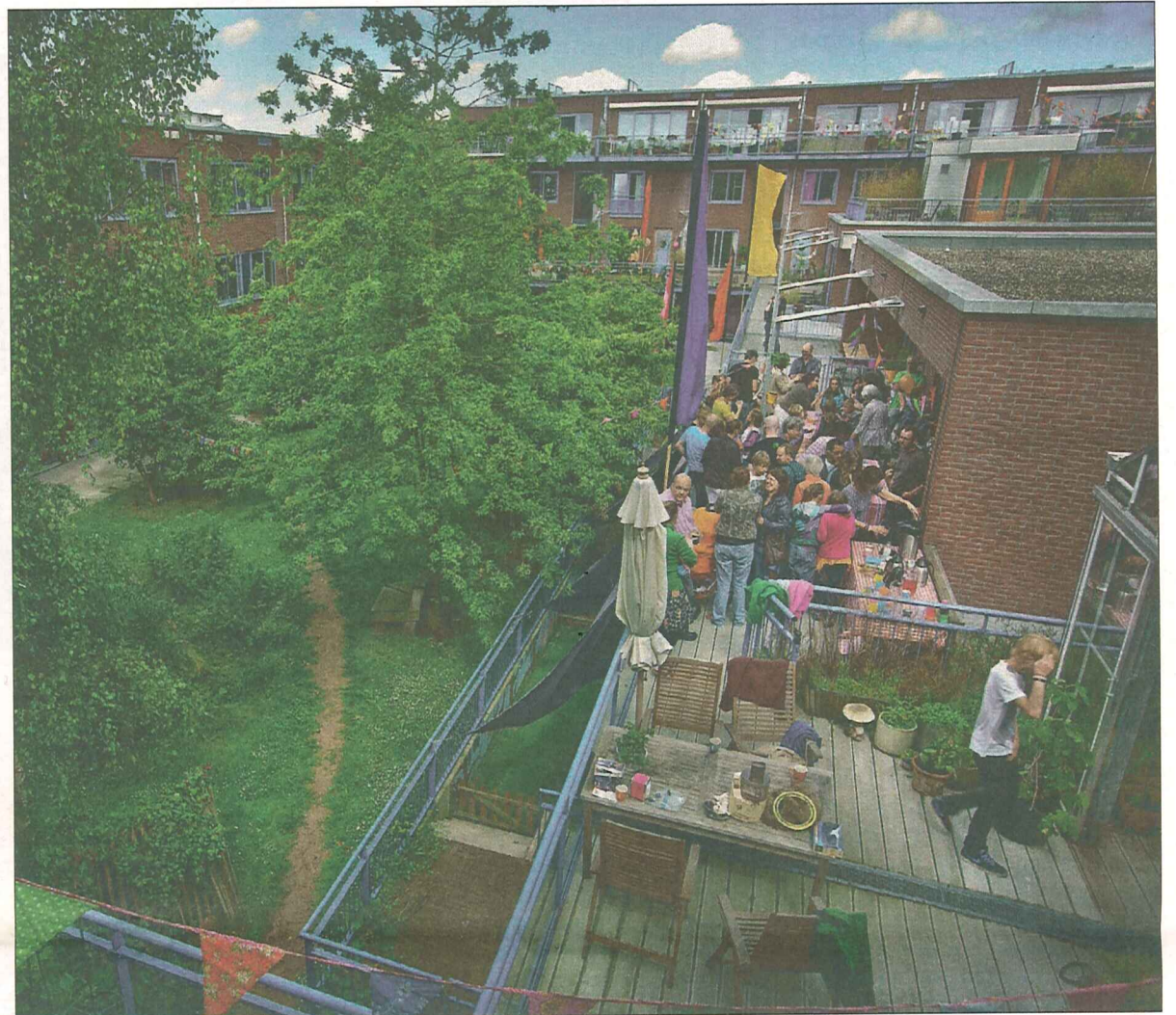
De woningen en binnentuin tijdens het 5-jarig bestaan.

De initiatiefgroep kon al snel tegen een relatief gunstig tarief een prachtstukje land bemachtigen