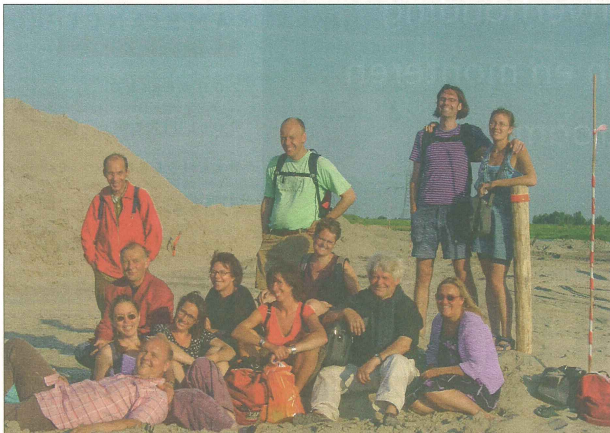
De eerste bewoners van Vrijburcht maakten tien jaar geleden kennis met hun nieuwe stekkie.